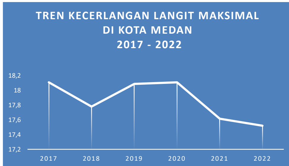
Gambar 2. Grafik Tren Kecerlangan Langit Malam tahun 2017-2022 menurut pembacaan SQM

Selanjutnya dengan mengolah rata-rata maksimum pembacaan SQM setiap tahun dan disajikan dalam bentuk grafik seperti ditunjukkan pada gambar 2. Dapat terlihat bahwa nilai maksimum di tahun 2022 berada pada nilai terendah, dan diperkirakan akan dapat semakin menurun apabila tidak ada penanganan terhadap polusi cahaya di kota Medan di tahun berikutnya.