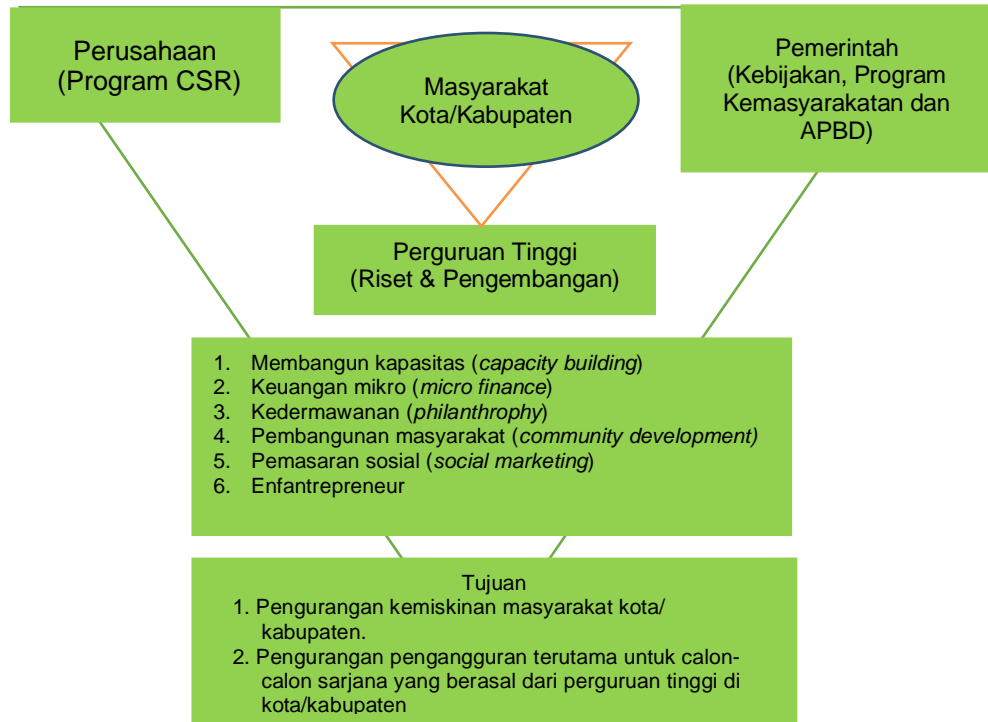
Gambar 1. Pola Kemitraan antara Perusahaan, Pemerintah, dan Lembaga Pendidikan untuk Masyarakat Kota/Kabupaten

dalam masyarakat. Gambaran yang menyeluruh tentang kemitraan antara perguruan tinggi, perusahaan dan pemerintah, dapat dilihat dalam gambar berikut: