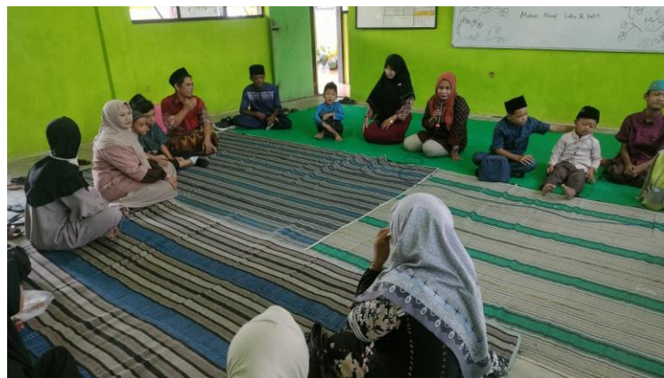
Gambar 2 Pengajian rutin Selasa Kliwon

Berdasarkan pemaparan di atas dapat ditarik kesimpulan bahwa Setiap Selasa Kliwon, SLB Gampengrejo mengadakan pengajian rutin sebagai forum penting bagi wali murid, guru, dan siswa. Lebih dari sekadar kegiatan keagamaan, acara ini menjadi wadah musyawarah untuk mendiskusikan kemajuan pendidikan anak, mempererat hubungan keluarga-sekolah, serta membentuk karakter dan perkembangan spiritual siswa. Hal ini sejalan dengan hasil penelitian dari Efendi & Maksun (2022) tentang peran pengajian dalam meningkatkan pemahaman nilai agama dan membentuk karakter luhur.