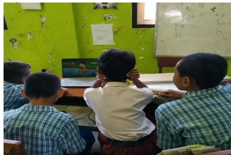
Gambar 7. Siswa menonton video animasi

Berdasarkan penjelasan sebelumnya, dapat disimpulkan bahwa Kurangnya fasilitas dan teknologi yang memadai di SLB menghambat pemanfaatan inovasi seperti perangkat lunak pembaca layar, aplikasi interaktif, dan materi audio-visual yang dapat disesuaikan dengan kebutuhan siswa dalam pembelajaran literasi keagamaan. Hal ini sejalan dengan hasil penelitian dari Firdausi et al. (2020) menunjukkan bahwa kurangnya fasilitas pendukung seperti proyektor LCD dapat memberikan dampak negatif terhadap motivasi belajar siswa. hal ini karena metode pembelajaran menjad kurang variatif dan cenderung monoton. Padahal, teknologi ini berpotensi besar untuk meningkatkan pemahaman dan kecintaan siswa terhadap agama. Investasi dalam penyediaan sarana prasarana yang memadai sangatlah penting untuk memaksimalkan potensi siswa dan meningkatkan kualitas literasi keagamaan mereka.