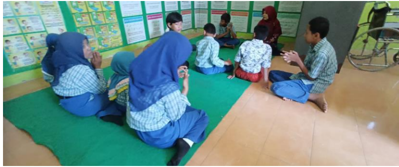
Gambar 1. Literasi keagamaan hari Kamis

bertujuan menciptakan proses belajar yang lebih inklusif, efektif, dan memperkuat kebersamaan.