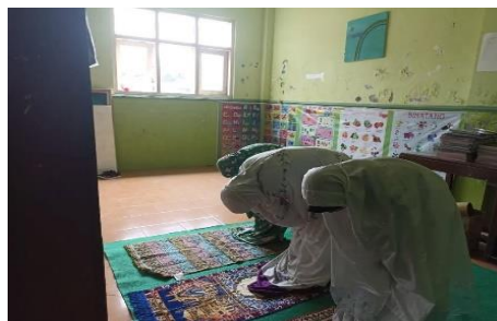
Gambar 3. Shalat dhuha berjamaah (shaf perempuan)

Berdasarkan pernyataan di atas dapat ditarik kesimpulan bahwa partisipasi aktif siswa dalam shalat berjamaah di sekolah memberikan dampak positif, terlihat dari kemampuan mereka menirukan bacaan shalat. Hal ini sejalan dengan hasil penelitian dari Djollong et al. (2019) bahwa lingkungan sekolah khususnya pendidik berperan sebagai panutan dengan memberikan contoh baik kepada siswa untuk ditiru dan diamalkan. Pembiasaan dan pengulangan shalat berjamaah juga menjadi fokus agar siswa terinternalisasi dan terbiasa melakukannya. Untuk pemahaman yang lebih konkret, guru mendemonstrasikan tata cara pelaksanaan shalat berjamaah.