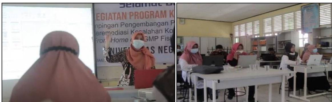
Gambar 2. Pembekalan Materi Program Resitasi Interaktif dan Demonstrasi Penggunaannya

Tahapan terakhir adalah tahap konfirmasi yakni pengumpulan data terkait pendapat peserta terhadap kegiatan pendampingan yang dilakukan. Pengumpulan data dilakukan melalui pemberian angket kepada peserta sebagai evaluasi dari kegiatan yang dilakukan. Berdasarkan evaluasi dan pengumpulan data yang dilakukan, diperoleh data bahwa kegiatan PKM ini dapat